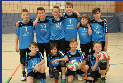
MÄNNLICHE U13, E-JUGEND