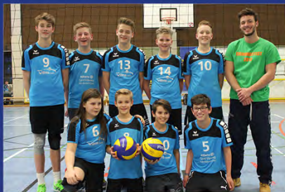
MÄNNLICHE U16, C-JUGEND