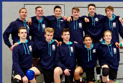
MÄNNLICHE U18, B-JUGEND