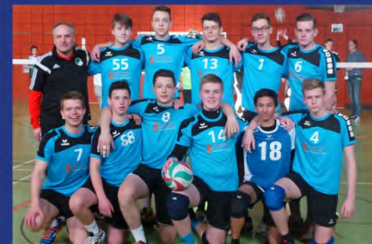
MÄNNLICHE U20, A-JUGEND