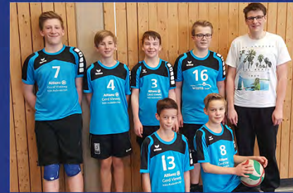
MÄNNLICHE U14, D-JUGEND