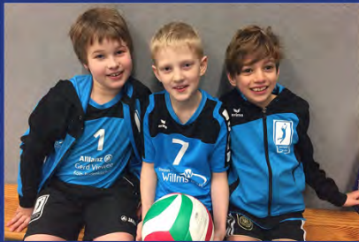
MÄNNLICHE U12, F-JUGEND